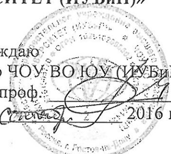
ГРАФИК ПРОВЕДЕНИЯ КОНСУЛЬТАЦИЙ И ТЕСТИРОВАНИЯ ПО РУССКОМУ ЯЗЫКУ КАК ИНОСТРАННОМУ ЯЗЫКУ ДЛЯ ИНОСТРАННЫХ ГРАЖДАН И ЛИЦ БЕЗ ГРАЖДАНСТВА В ЛОКАЛЬНОМ ЦЕНТРЕ ТЕСТИРОВАНИЯ ИНОСТРАННЫХ ГРАЖДАН ПО РУССКОМУ ЯЗЫКУ, ИСТОРИИ И ОСНОВАМ ЗАКОНОДАТЕЛЬСТВА РОССИЙСКОЙ ФЕДЕРАЦИИ